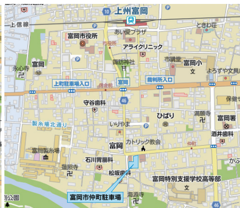
富岡市仲町駐車場 シャトルバス降場 (降車専用)