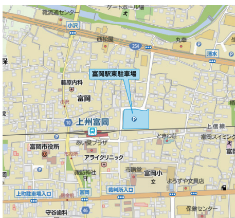
富岡駅東駐車場 シャトルバス乗降場