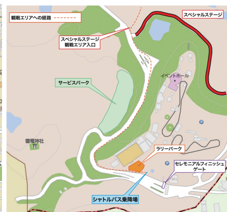
群馬サファリパーク シャトルバス乗降場